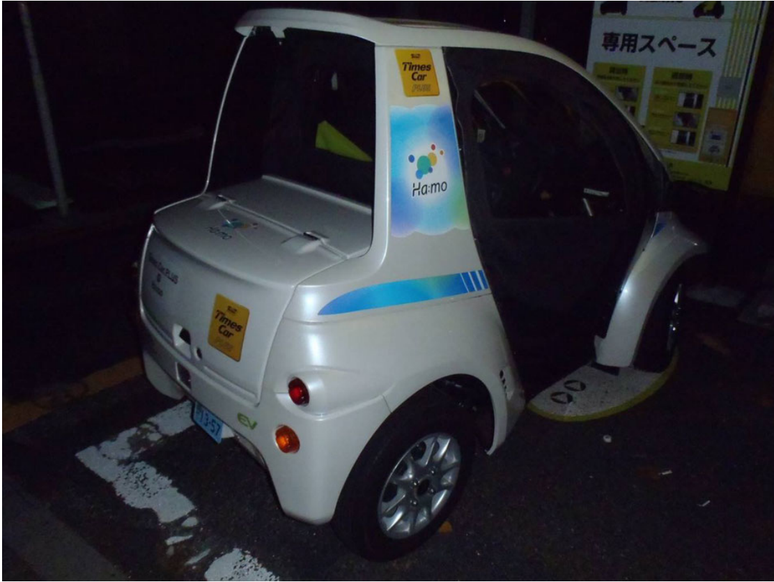
Aperçue au Japon, encore plus petite que la "Smart"!