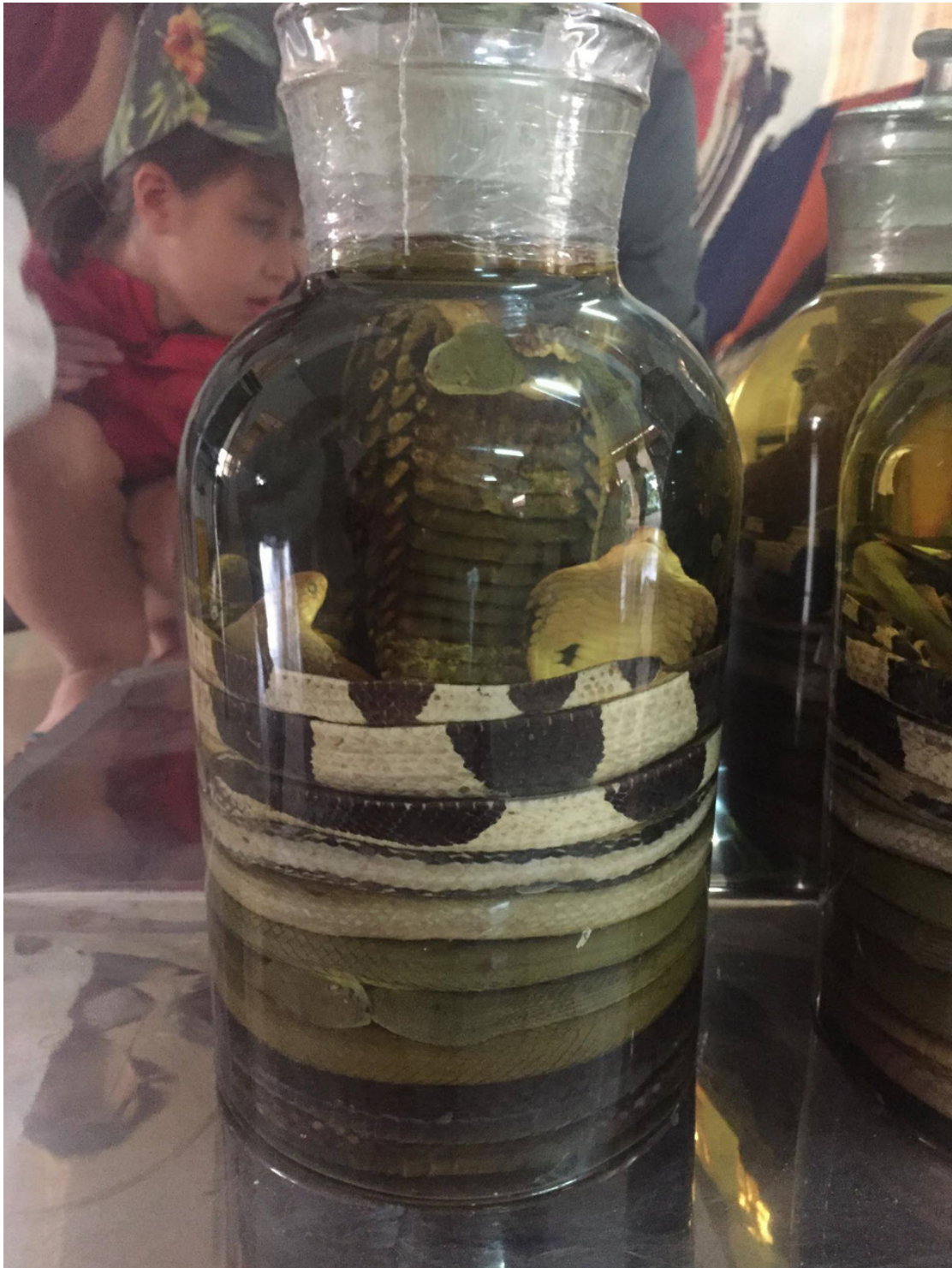
Du serpent mariné, bon pour certaines maladies et remplacerait le viagra! (Vietnam)