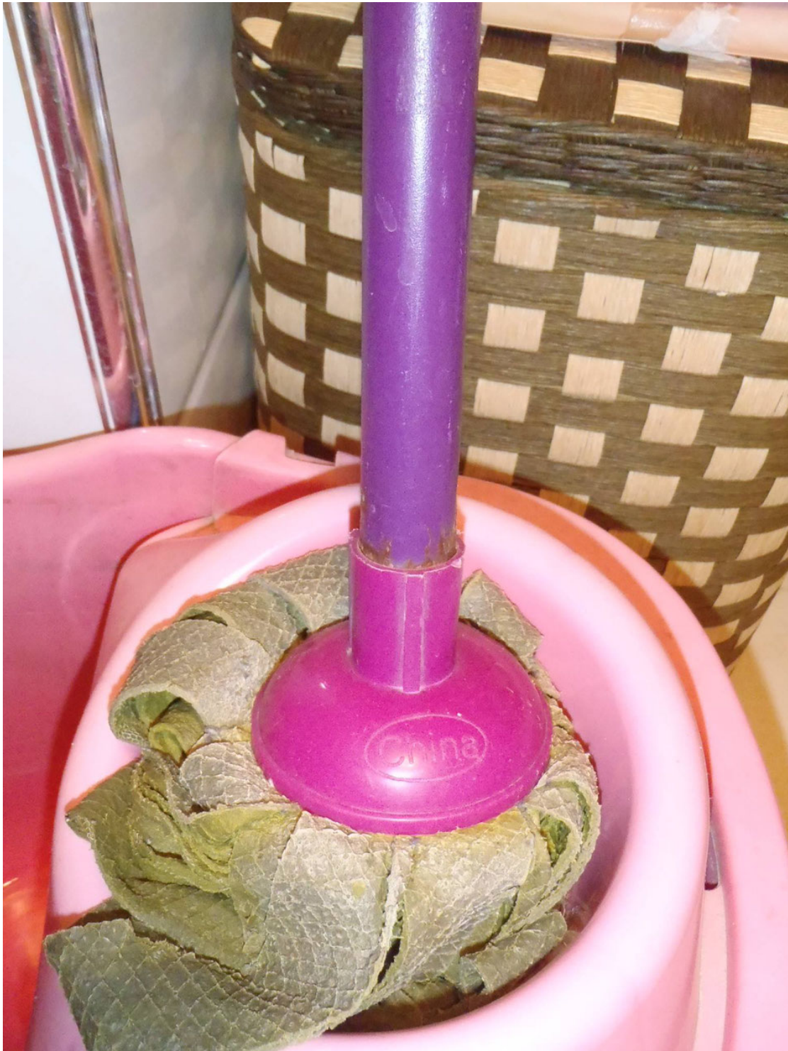
Made in China en Chine :)