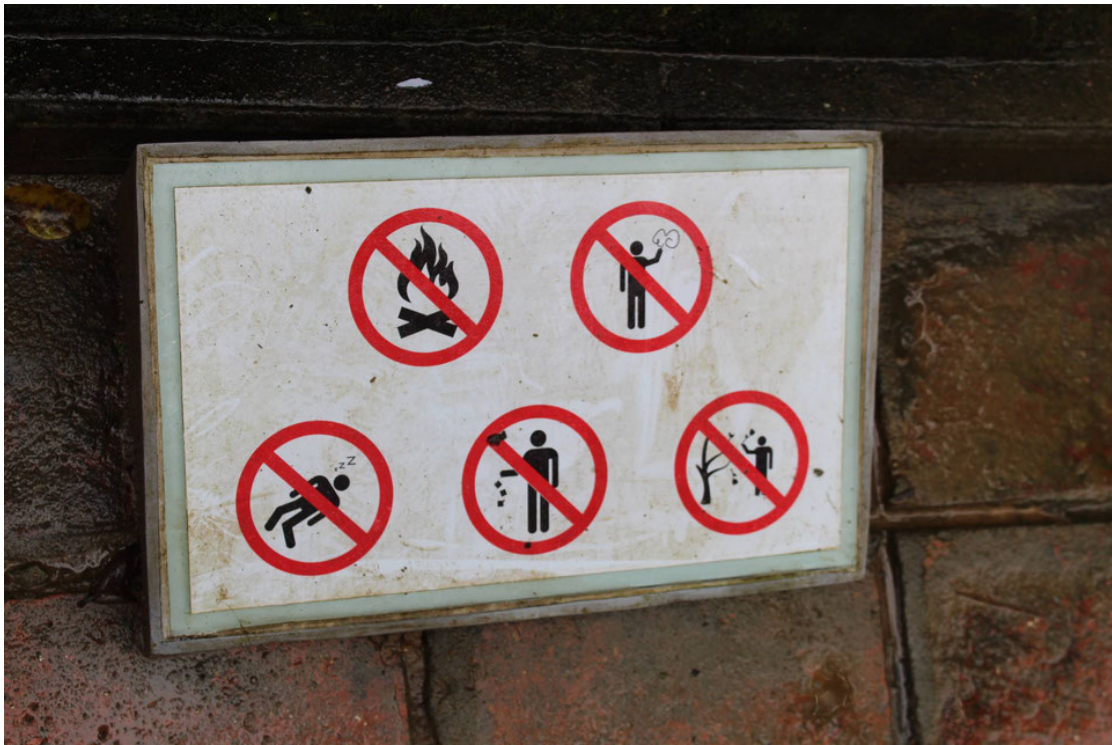
Pas le droit de bien des trucs et en plus pas le droit de dormir! (Vietnam)