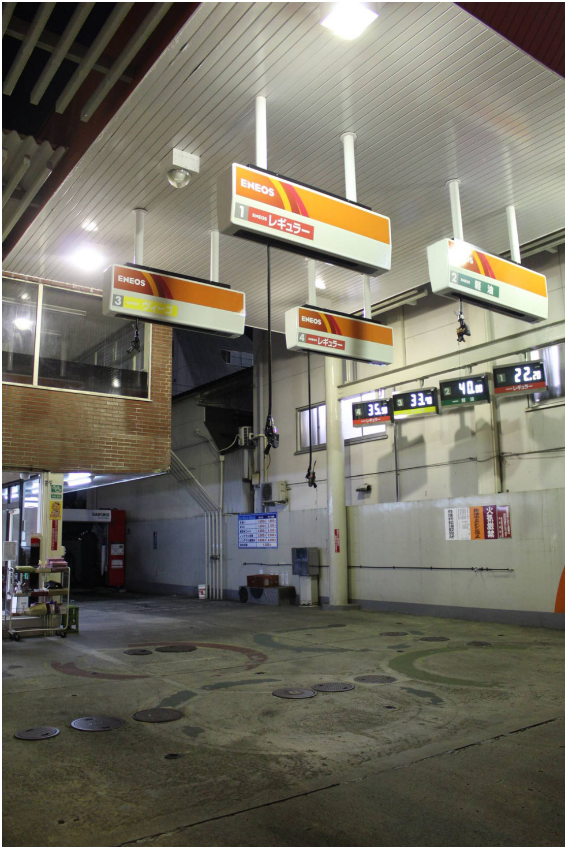
Station-service avec pompes suspendues...pour sauver de l'espace! (Tokyo)