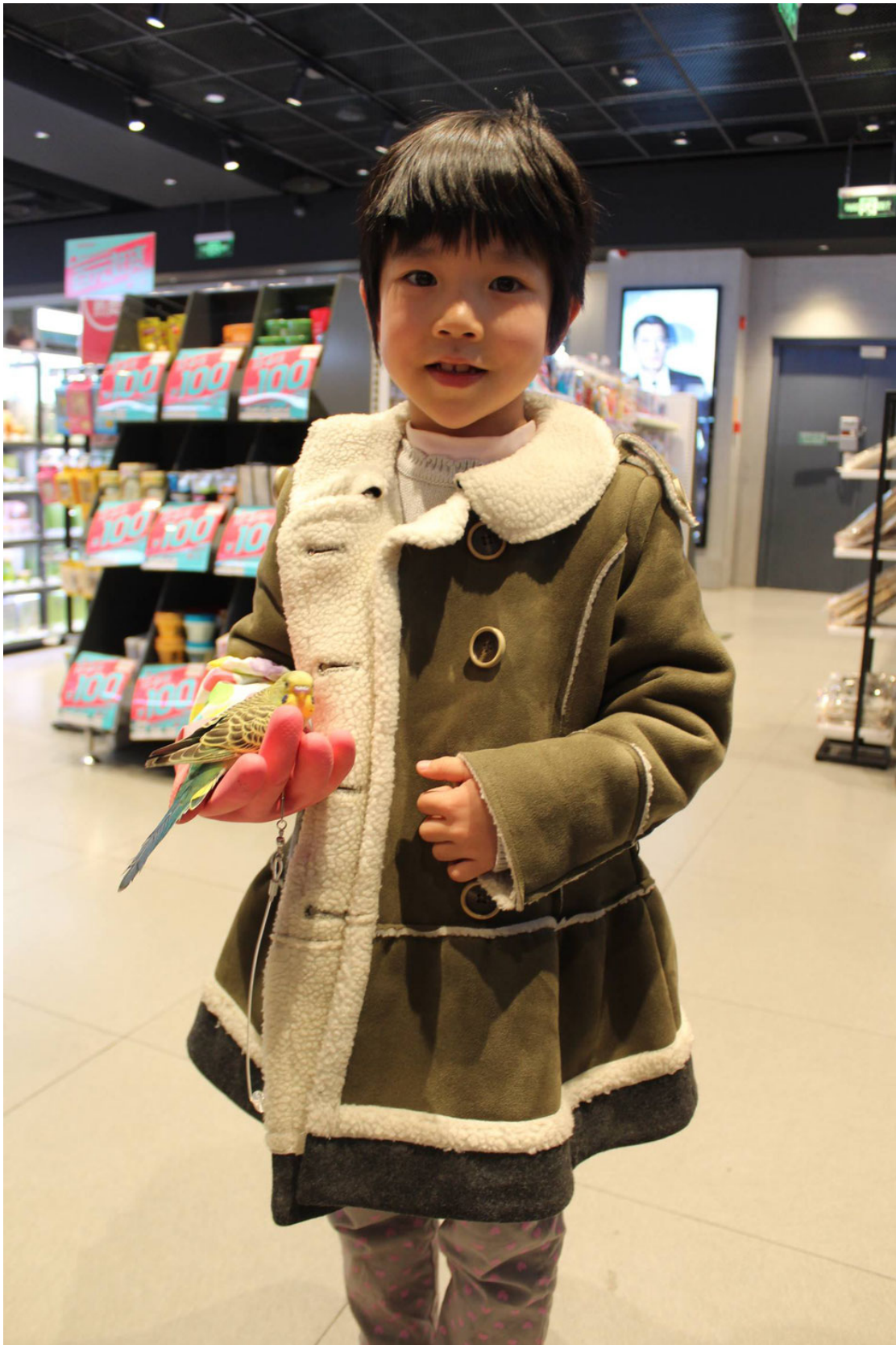
Une petite fille aperçue dans un pharmacie qui magasine avec sa perruche apprivoisée! (À Chengdu en Chine)