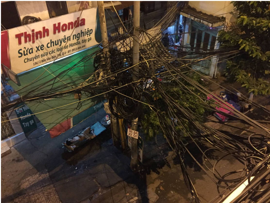
Sans commentaire! (Vietnam)