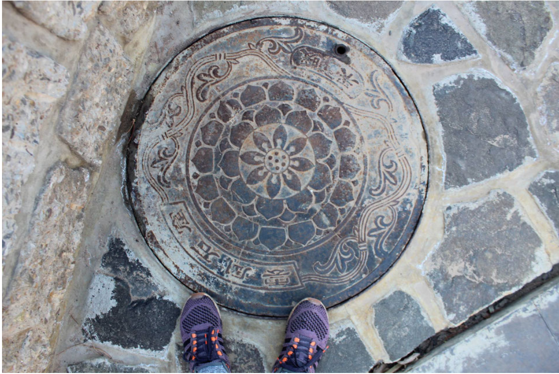
Une bouche d'égoût qui a du style! (en Chine)