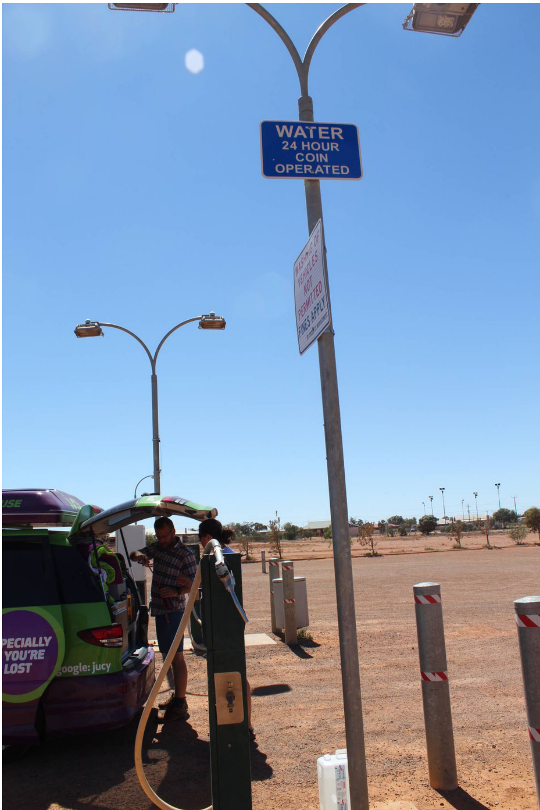
Distributrice d'eau potable dans le désert australien.