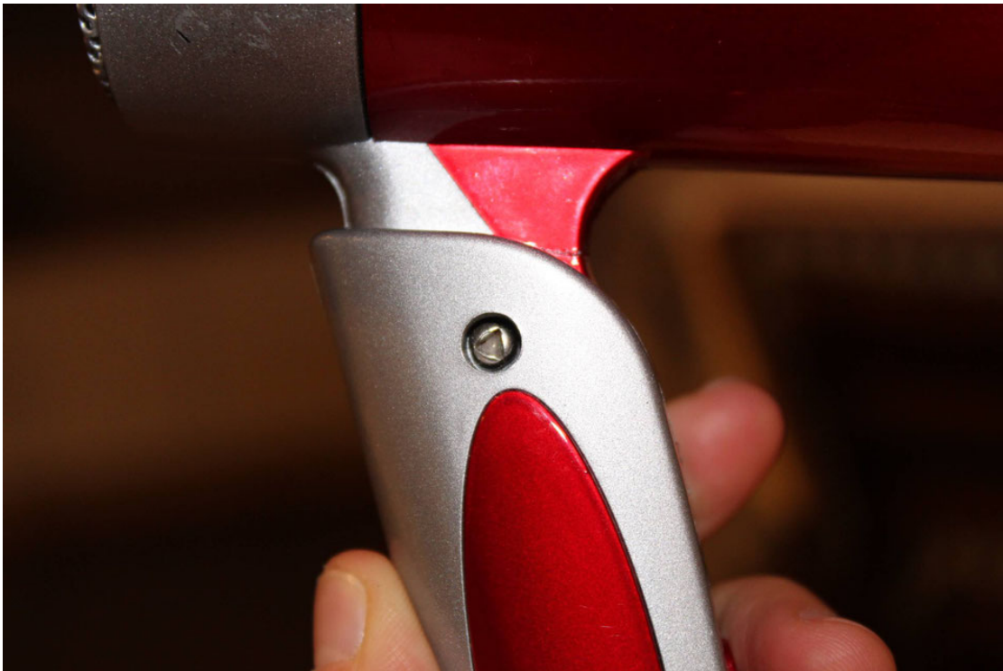
Vis étoile, carrée ou plate, il y a aussi des vis triangles au Vietnam!