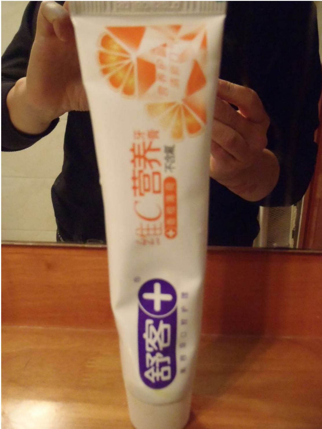
Dentifrice chinois saveur orange...