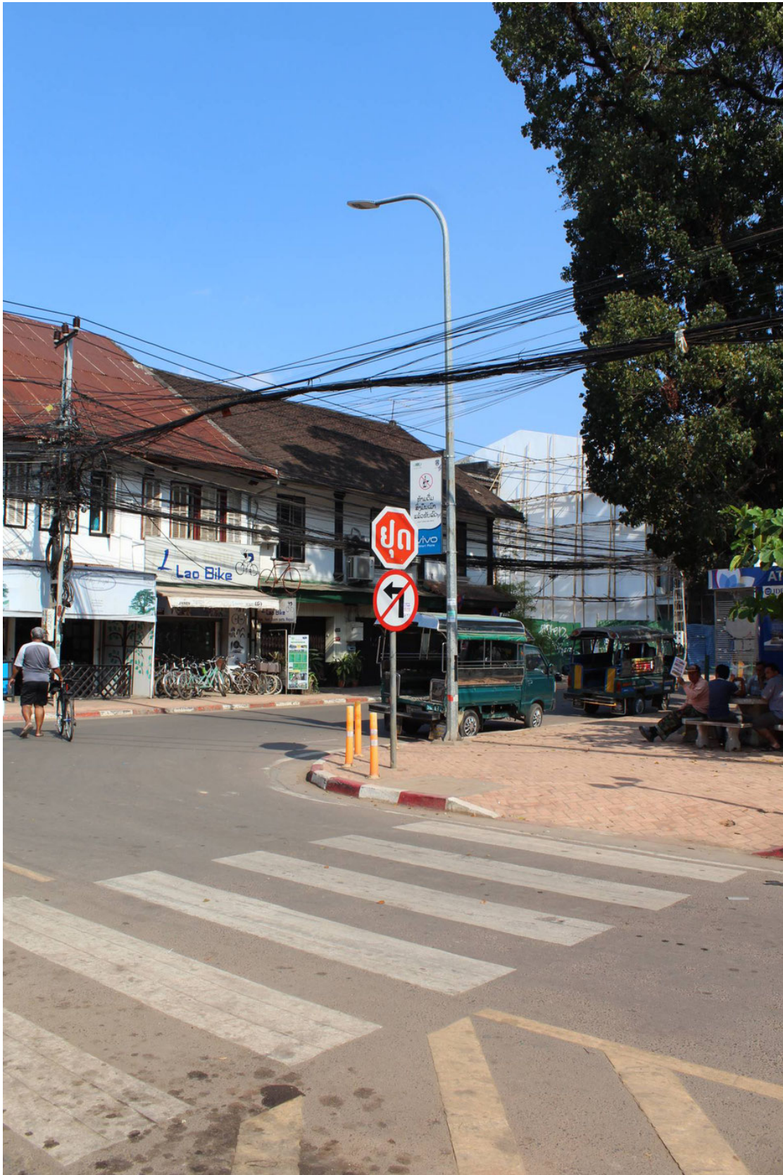
Un arrêt-stop laotien.