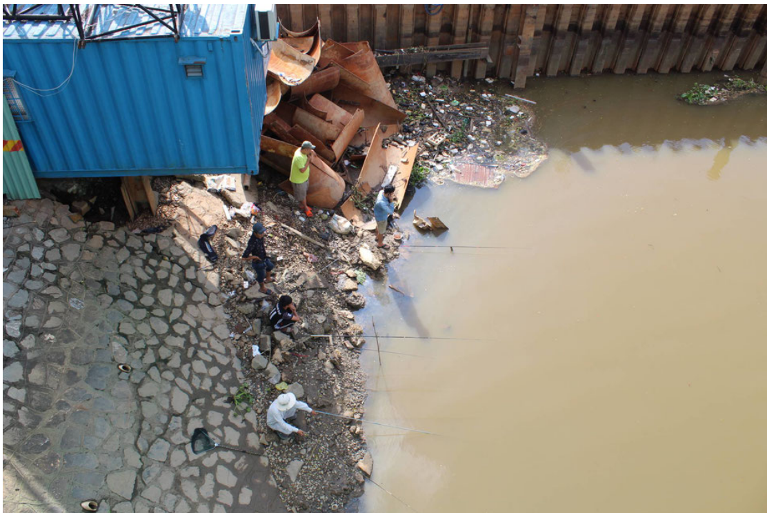
On mange du poisson pour souper! (Saigon, Vietnam)